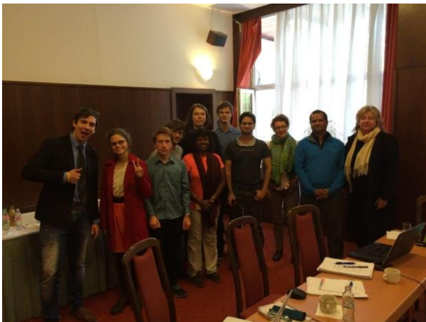
Network Council Dublin 2016 novemberében