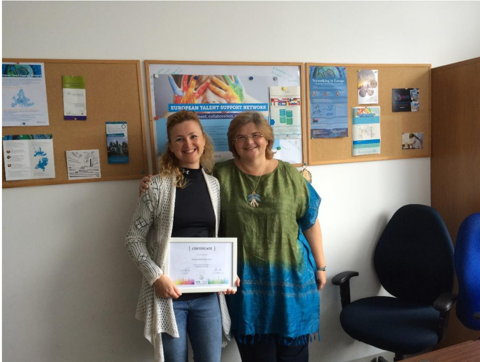
Ír kollégák látogatása az EUTK-ban 2017 januárjában