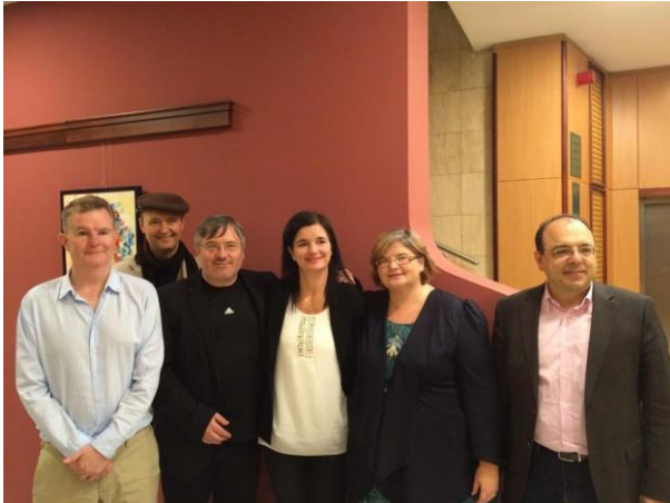
Ifjúsági Platform tanácsa 2016 októberében

Tematikus fotódokumentáció részletek (a többi kép CD-n mellékelve) Hálózatfejlesztés, nemzetközi tapasztalatcsere_1_Stratégiai fejlesztések Hálózati Tanács 2016 októberében